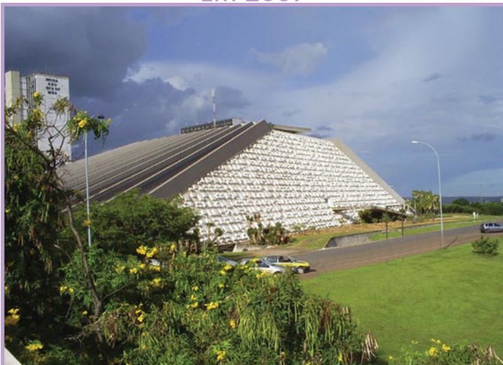
Teatro Nacional Claudio Santoro – Brasília, DF Sala Villa-Lobos (1350 lugares)

O imenso palco (26 m por 17 m) - local das apresentações, da 2ª. Etapa e da Final do Concurso – dispõe de todos os recursos cênicos de uma grande casa de espetáculos (luz, som, camarins individuais, camarins coletivos, equipe técnica profissional etc.);